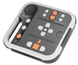
Un lecteur de livres audio *