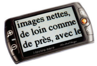
Une loupe électronique portable *