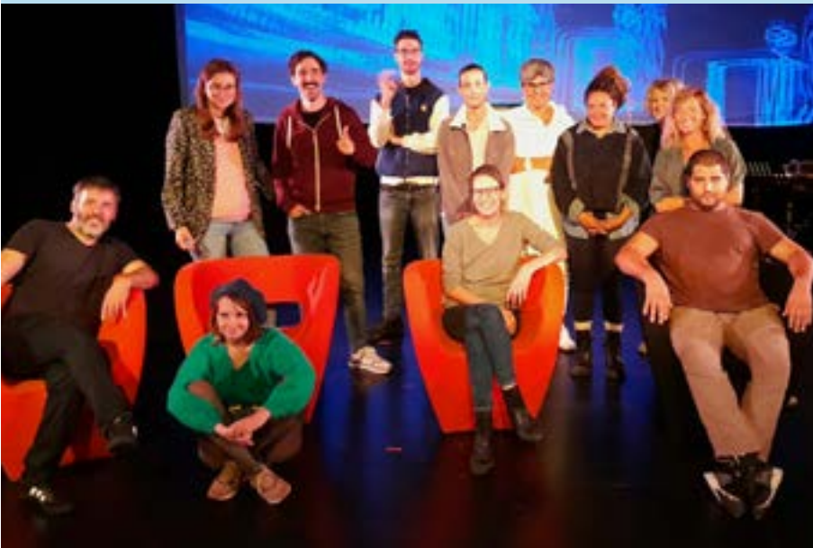
Les comédiens de la Cie L'été des sauvages et des personnes avec TSA lors d'une résidence d'artistes

Cette nouvelle édition offre, comme l'an dernier, la possibilité de découvrir un spectacle grâce au partenariat avec le Théâtre de Gascogne. La pièce de théâtre Oublier le bruit du frigo , intégrée dans la programmation de la saison culturelle de l'agglomération du Marsan, sera interprétée par la Compagnie L'été des sauvages au Théâtre du Pégly.